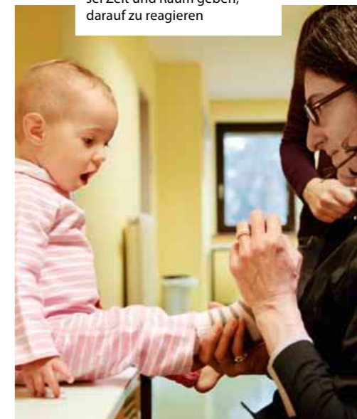
Dem Kind beim Sockenwechsel Zeit und Raum geben, darauf zu reagieren

Eine Bezugserzieherin, die durch immer wiederkehrende Begegnungen das einzelne Kind kontinuierlich kennenlernt, vermittelt ihm mit der Zeit die nötige Sicherheit und Stabilität. Das kleine Kind gewinnt Vertrauen, Freude am Miteinander und wird zur Kooperation bereit. Dazu braucht es auch die Möglichkeit, sich in Bezug auf die Handlungsabläufe orientieren zu können. Durch Blickkontakt, sprachliche Ankündigung der Handlungsschritte, durch Gesten, Zeigen der Gegenstände und das Warten auf die Bereitschaft des Kindes und auf sein Verstehen dessen, was kommen oder von ihm erwartet wird, gibt die Erzieherin dem Interesse und der Kooperationsfreude des Kindes Zeit, Raum und Gelegenheit. „Zusammenwirken und Kooperieren bedeutet im Grunde, dass das Kind mit seinen eigenen Bewegungen auf die begonnene Geste des Erwachsenen antwortet. Dazu braucht es Zeit und Raum. Dies wird ihm dadurch ermöglicht, dass der Erwachsene seine Gesten verzögert oder innehält und abwartet. Wenn man z. B. beim Anziehen den Ärmel gleich über den Arm des Säuglings streift, hat er keine Gelegen-